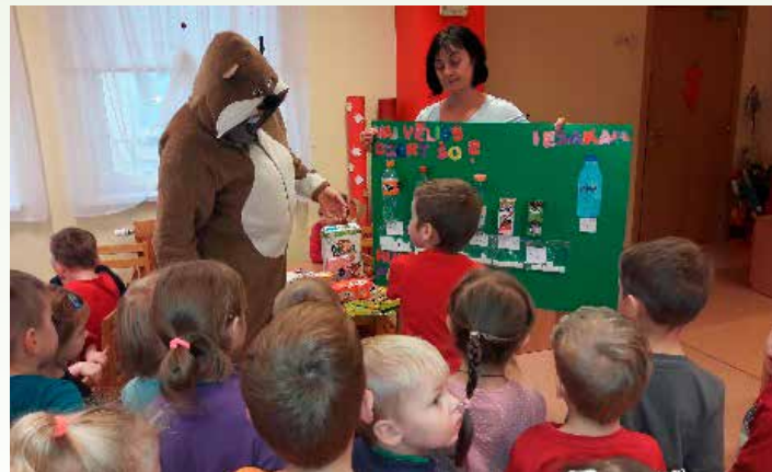
Bērni izpēta cukura daudzumu saldinātajos dzērienos

- Aicinājumu „Ēdīsim atbildīgi!” un plakātu izvietošana Saulainē un Pilsrundālē, kā arī