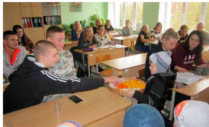
Kandavas Lauksaimniecības tehnikuma Saulaines teritoriālās struktūrvienības audzēkņiem bērni iesaka: “Saldos našķus labāk aizvietot ar veselīgiem našķiem.”